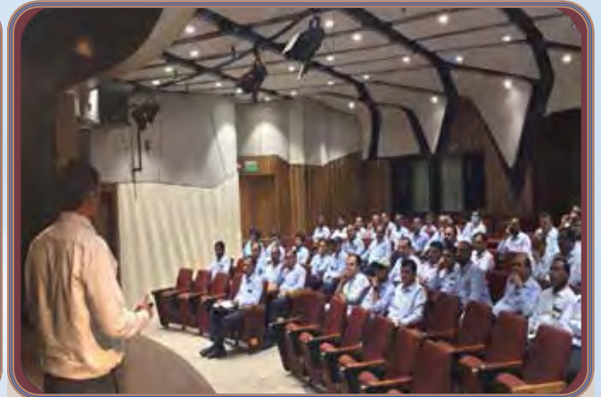
दिनांक 12.01.2026 को सतर्कता विभाग द्वारा “वार्षिक संपत्ति विवरण” विषय पर सत्र का आयोजन।