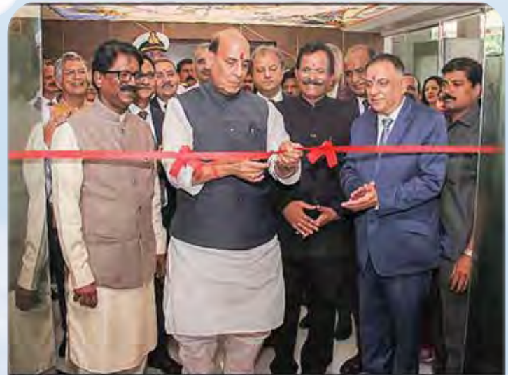
28 सितम्बर 2019 को एमडीएल की हेरिटेज गैलरी का उद्घाटन करते हुए माननीय रक्षामंत्री श्री राजनाथ सिंह साथ में भारी उद्योग मंत्री श्री अरविंद सावंत तथा एमडीएल के सीएमडी के साथ अन्य अधिकारीगण