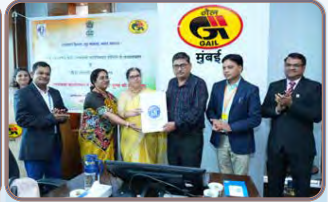
माझगांव डॉक शिपबिल्डर्स लिमिटेड द्वारा नगर राजभाषा कार्यन्वयन समिति, मुंबई (उपक्रम) के तत्वावधान में 24 नवंबर, 2025 को ऑनलाइन (ई-मेल) आधार पर "मुंशी प्रेमचंद पर आधारित सामान्य ज्ञान प्रतियोगिता" का आयोजन किया गया। इस अवसर पर वरिष्ठगणों से पुरस्कार प्राप्त करते हुए विजेता प्रतिभागी।