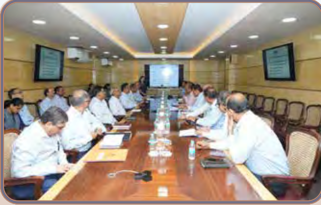
दिनांक 20 मार्च 2026 को राजभाषा अनुभाग द्वारा आयोजित तिमाही बैठक में उपस्थित निदेशकगण एवं वरिष्ठगण।