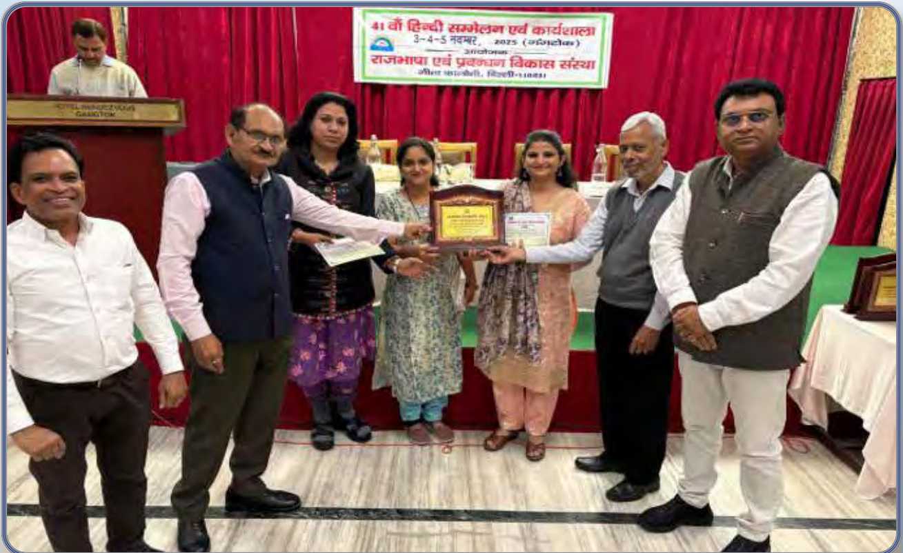
दिनांक 05 नवंबर 2025 को राजभाषा एवं प्रबंधन विकास संस्था द्वारा माझगांव डॉक शिपबिल्डर्स लिमिटेड को हिंदी में उत्कृष्ट कार्यनिष्पादन हेतु सम्मानित किया गया।