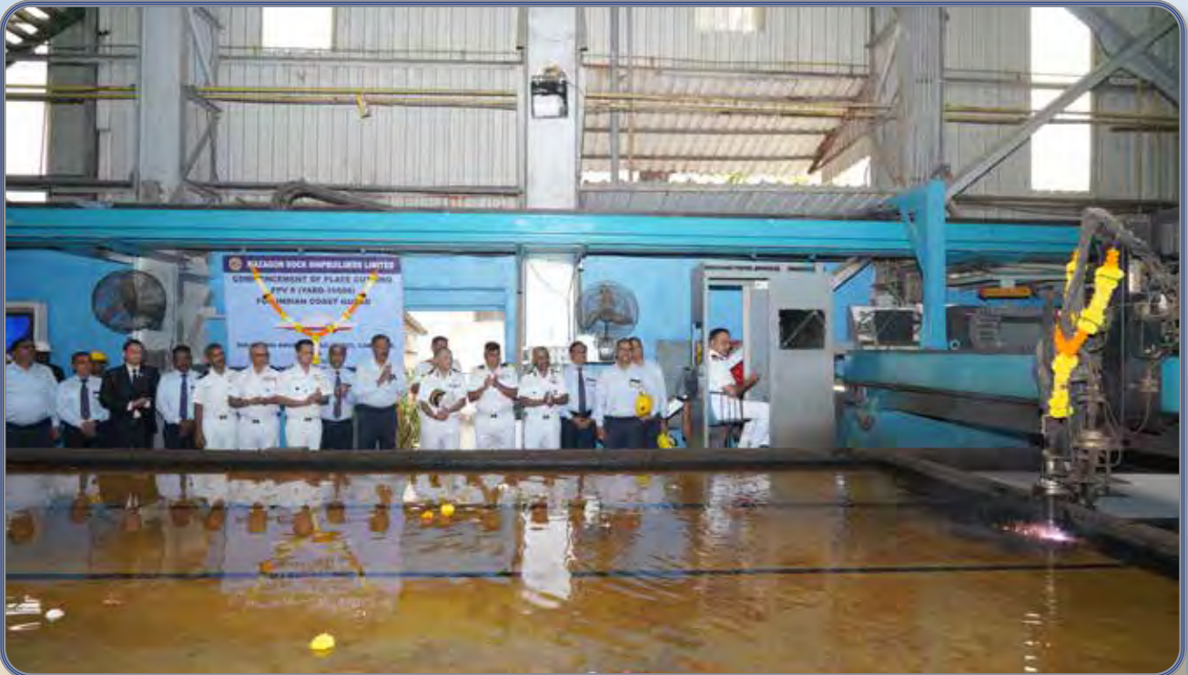
दिनांक 29.01.2026 को भारतीय तटरक्षक बल के लिए 6 तीव्र गश्ती पोतों (यार्ड-16506) की प्लेट कटिंग समारोह के अवसर पर उपस्थित एमडीएल एवं नौसेना के वरिष्ठ अधिकारीगण।