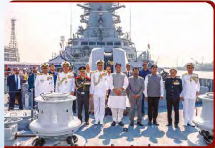
माननीय रक्षा मंत्री श्री राजनाथ सिंह द्वारा आईएनएस मोरमोगाओ की भारतीय नौसेना को कमीशनिंग