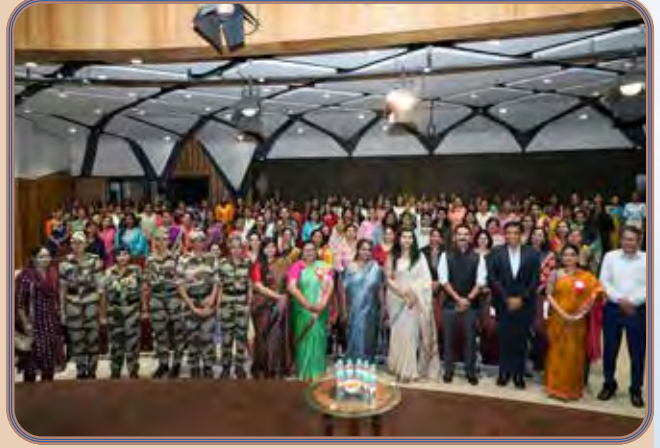
दिनांक 06.03.2026 को अंतर्राष्ट्रीय महिला दिवस के उपलक्ष्य में आयोजित कार्यक्रम में उपस्थित आदरणीय वरिष्ठगण।