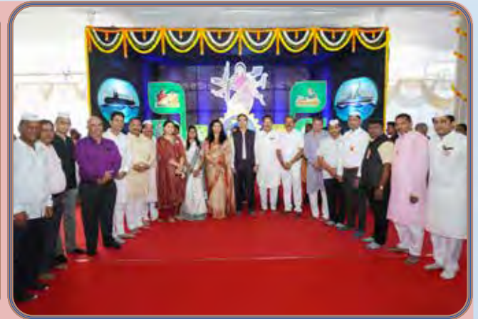
दिनांक 20.12.2025 को श्री सत्यनारायण महापूजा एवं यार्ड ओपन डे के अवसर पर उपस्थित अध्यक्ष एवं प्रबंध निदेशक एवं वरिष्ठ अधिकारीगण।