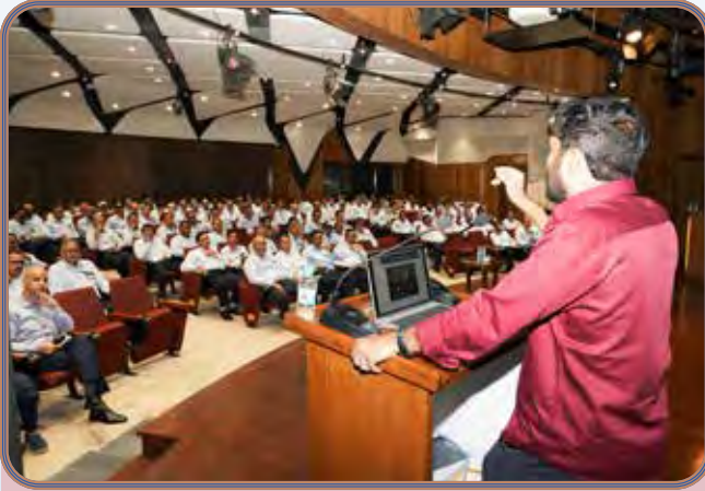
दिनांक 10.11.2025 को पद्मश्री आनंद कुमार (सुपर 30) द्वारा “दृढ़ता का निर्माण (प्रेरणा); - तमाम मुश्किलों के बावजूद सफलता कैसे पाएँ” विषय पर सत्र का आयोजन।