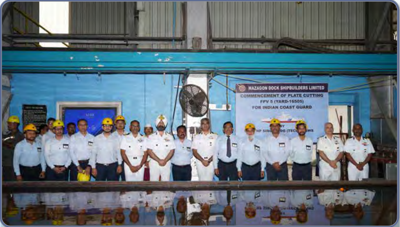
दिनांक 30.10.2025को भारतीय तटरक्षक बल के लिए 6 तीव्र गश्ती पोतों (यार्ड-16505) के प्लेट कटिंग समारोह के अवसर पर उपस्थित एमडीएल एवं नौसेना के वरिष्ठ अधिकारीगण।