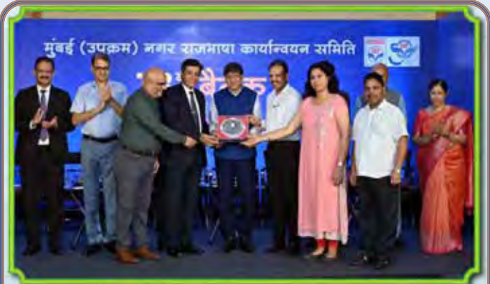
एमडीएल द्वारा प्रकाशित राजभाषा पत्रिका "जलतरंग" को मुंबई उपक्रम टॉलिक द्वारा 17 जुलाई, 2024 को प्रथम पुरस्कार से पुरस्कृत किया गया।