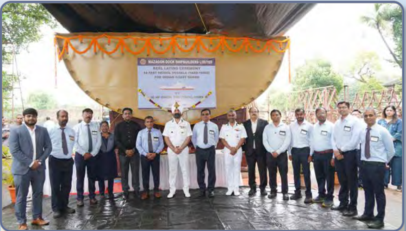
दिनांक 30.10.2025 को भारतीय तटरक्षक बल के लिए 14 तीव्र गश्ती पोतों (यार्ड-16502) के कील लेईंग समारोह के अवसर पर उपस्थित एमडीएल एवं नौसेना के वरिष्ठ अधिकारीगण।