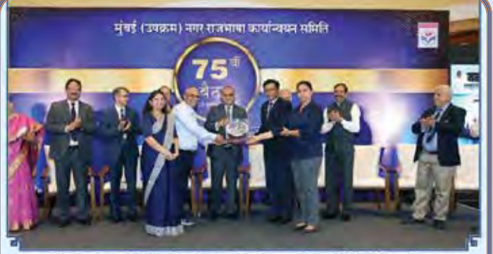
माझगांव डॉक शिपयार्डर्स लिमिटेड को वर्ष 2024-25 के दौरान गृह पत्रिकाओं की श्रेणी में मुंबई (उपक्रम) नगर राजभाषा कार्यान्वयन समिति द्वारा 'द्वितीय पुरस्कार' से सम्मानित किया गया, इस अवसर पर पुरस्कार प्राप्त करते हुए निदेशक (समाचार योजना एवं कार्रगिक), महाप्रबंधक (मानव संसाधन एवं राजभाषा) एवं अन्य अधिकारीगण।