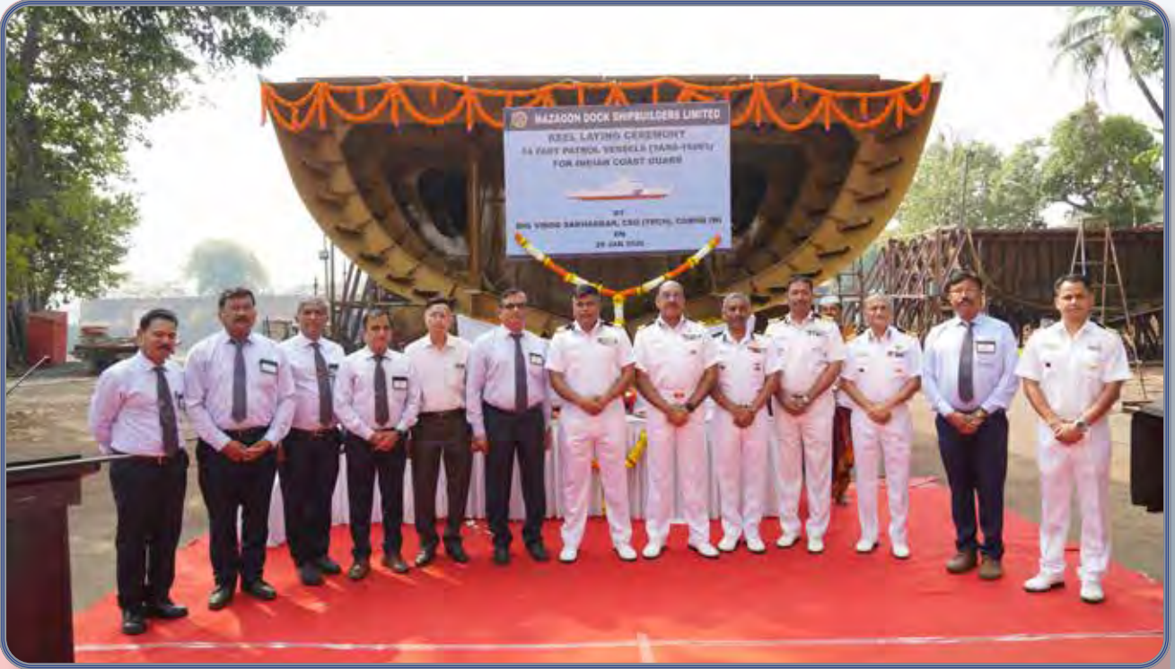
दिनांक 29.01.2026 को भारतीय तटरक्षक बल के लिए 14 तीव्र गश्ती पोतों (यार्ड-16503) के कील लेईंग समारोह के अवसर पर उपस्थित एमडीएल एवं नौसेना के वरिष्ठ अधिकारीगण।