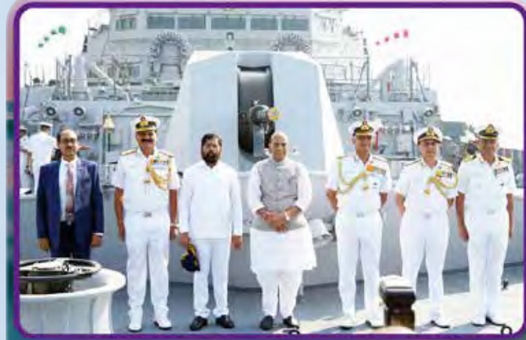
26 दिसंबर 2023 को माननीय रक्षा मंत्री श्री राजनाथ सिंह द्वारा आईएनएस इम्फाल की भारतीय नौसेना को कमीशनिंग।